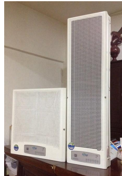
旗舰型 增加遥控功能，并增加活性炭去除异味功能